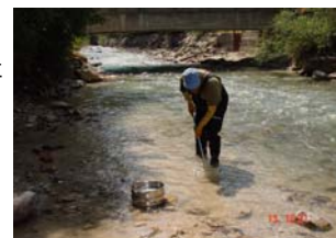
Opération de prélèvement

La valeur ajoutée du CT2M est d'avoir su s'adapter à notre besoin et concevoir une intervention « à la carte ».